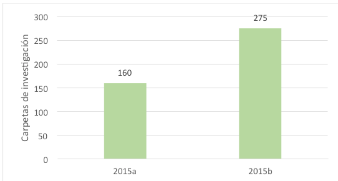
GRÁFICA 1. CARPETAS DE INVESTIGACIÓN INICIADAS POR VIOLACIÓN EN SAN LUIS POTOSÍ EN 2015